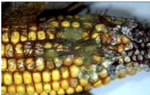
Slika 2. Primjer rasta toksikotvornih plijesni

Mikotoksini uzrokuju intoksikacije u ljudi i životinja. Do intoksikacija najčešće dolazi konzumacijom kontaminirane hrane, ali su mogući i drugi načini intoksikacije (inhalacijom ili putem kože). Za procjenu potencijalnog nepoželjnog učinka mikotoksina na ljude i životinje potrebno je poznavati uvjete njihova nastanka, učestalost, toksičnost, biotransformaciju, te mogućnosti inaktivacije u slučaju kada je njihova pojavnost neizbježna. Uz to što mikotoksini mogu uzrokovati intoksikacije u životinja, te utjecati na proizvodne rezultate i umanjiti hranidbenu vrijednost hrane za životinje, važna je i mogućnost pojave rezidua u proizvodima animalnog podrijetla jer konzumacija takvih proizvoda može dovesti do intoksikacija u ljudi (Sokolović i sur., 2015.).