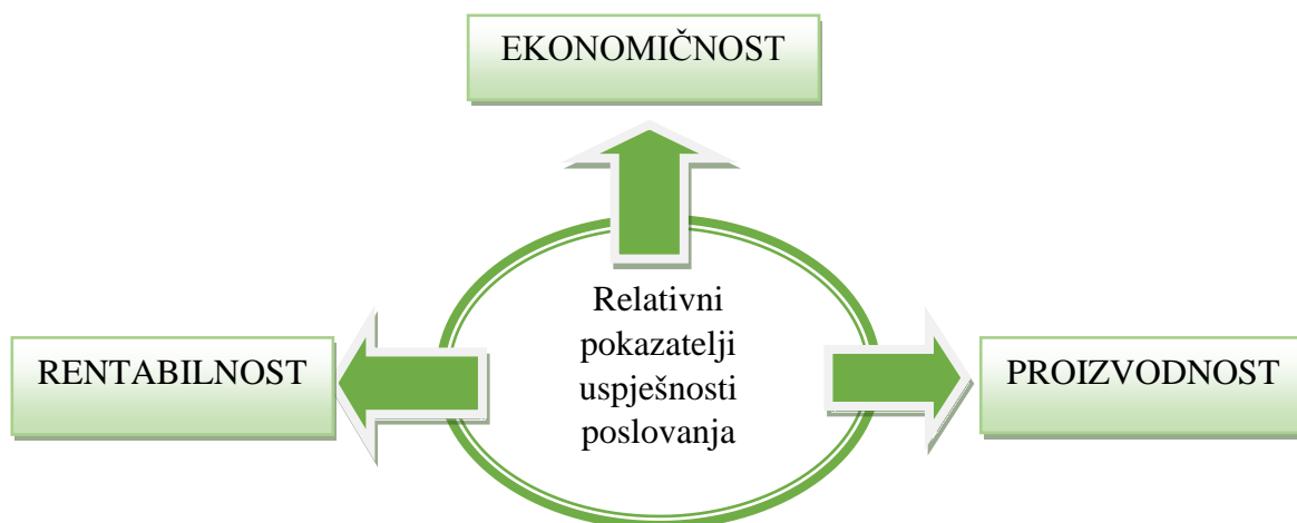
Slika 1. Relativni pokazatelji uspješnosti poslovanja

Relativni pokazatelji uspješnosti poslovanja su: