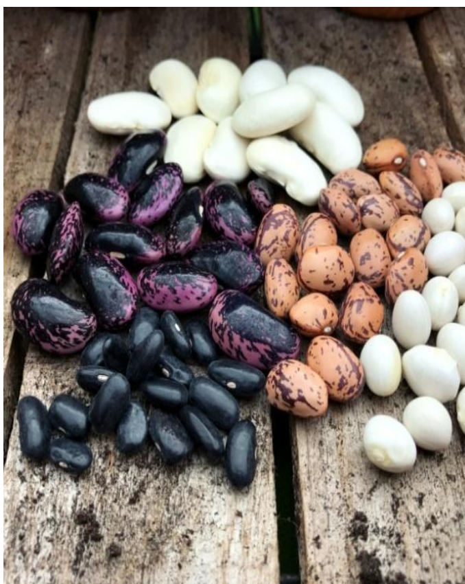
Slika 5. Izgled sjemenki graha

Masa 1000 sjemenki iznosi od 250 do 800 grama. Haploidni broj kromosoma je n = 11 (Spasojević i sur., 1984.). U povoljnim uvjetima sjeme može zadržati klijavost 4 do 5 godina.