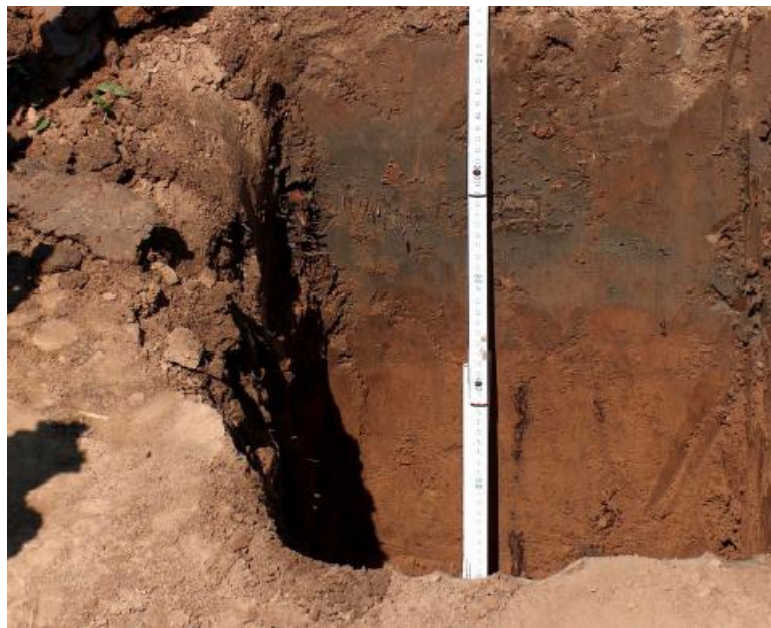
Slika 6. Eutrični kambisol

Na području Osječko – baranjske županije tla su različita po sastavu, strukturi i plodnosti. Najčešći tipovi tla koje na ovom području susrećemo su eutričnikambisol (Slika 6.), pseudoglej, černozem koji je često degradiran i ritska crnica.