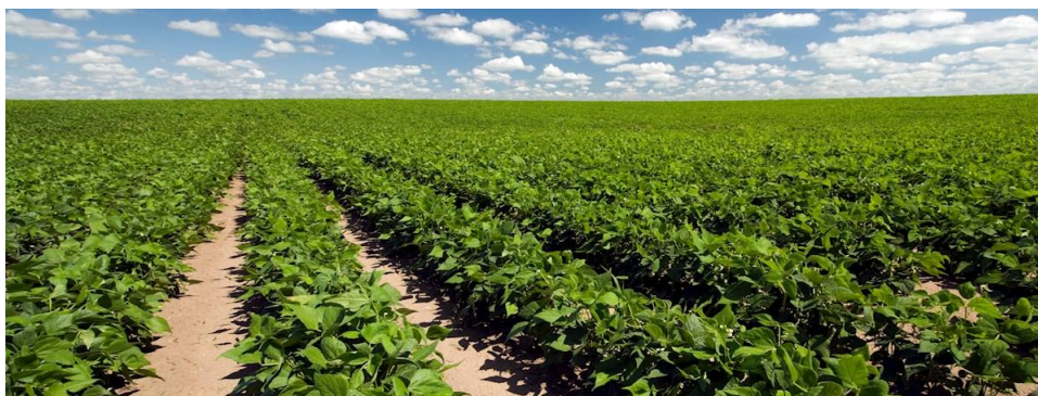
Slika 7. Polje graha